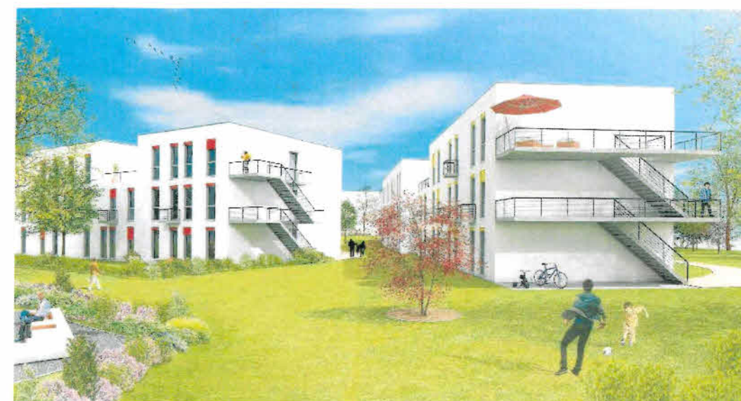
Eine Siedlung für Mitarbeiter mittelständischer Firmen in Berlin könnte so aussehen. Noch existieren nur Entwürfe.