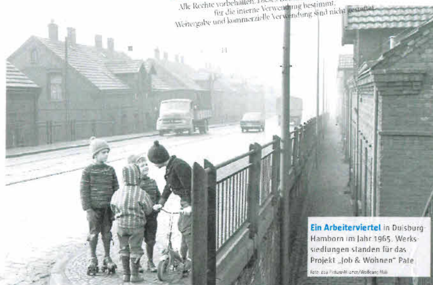
Ein Arbeiterviertel in Duisburg-Hamborn im Jahr 1965. Werksiedlungen standen für das Projekt „Job & Wohnen“ Pate.

Kritiker werfen der Bahn vor, ihre Grundstücke vor Jahren an Privatinvestoren verkauft zu haben, die für stetig steigende Mieten verantwortlich seien. Indirekt habe die DB somit zum Wohnungsproblem in den Großstädten beigetragen.